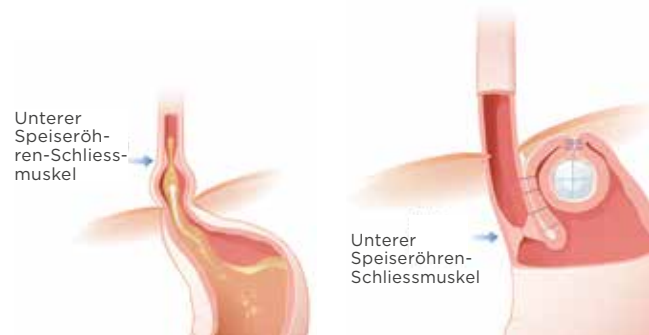
Abb. 3: RefluxStop, links vor dem Eingriff und rechts danach

tiefer gelegt. Eine Silikonkugel, die im Magen oberhalb des Schliessmuskels eingestülpt wird, dient durch Druck von aussen auf die Speiseröhre als «Rückschlagventil», das den Rückfluss in die Speiseröhre verhindert (vgl. Abb. 3). Der Vorteil dieser Methode besteht darin, dass der natürliche Schliessmuskel nicht durch eine Manschette von aussen gestört und die Speiseröhre in ihrer Pumpfunktion weniger behindert wird. Dadurch ist der RefluxStop auch bei schwacher Druckmessung noch anwendbar. Bei gleichzeitigem Vorliegen eines Zwerchfellbruches wird dieser wie bei einer Fundoplicatio verschlossen. Die Ergebnisse der klinischen Studie sind ausgezeichnet. Die Langzeit-Ergebnisse bleiben abzuwarten.